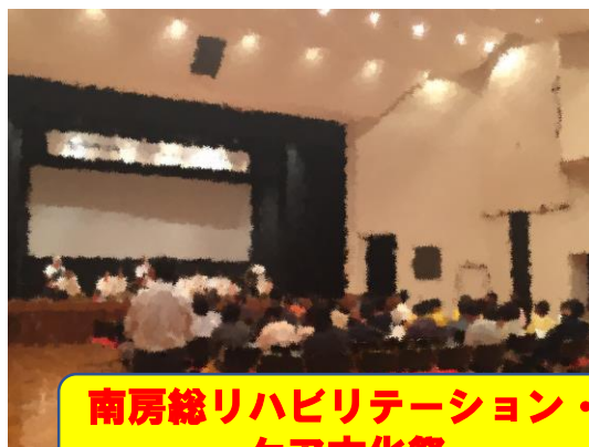
南房総リハビリテーション・ ケア文化祭