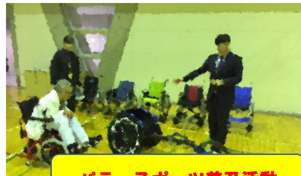
パラ・スポーツ普及活動