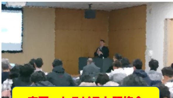
安房・セラピスト研修会