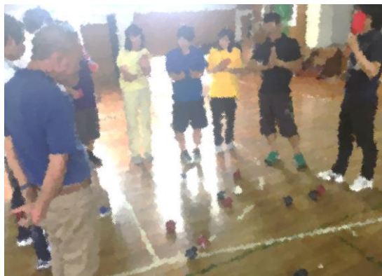
学校の先生への 体験会